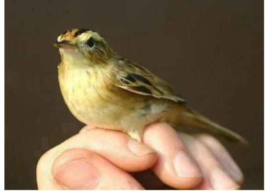
Zeldzame gasten in Meijndel: links een Grote Karekiet op 20 augustus en rechts een Waterrietzanger op de 15e. Ringers: Wijnand Bleumink, Maarten Verrips en Cocky Boelen

In september was de Zwartkop als gewoonlijk de meest gevangen soort, met forse dagtotalen op 2, 3 en 17 september (69, 61 en 81 stuks). De enige Draaihals van de jaarlijst kwam binnen op 3 september terwijl ook de enige Sperwergrasmus dit jaar een septembervangst was op de 18e. De Tjiftjaf was nooit zo talrijk als dit jaar. Pieken in de vangst van deze soort deden zich voor begin augustus, eind september en de eerste twee decaden van oktober. De Grote Gele Kwikstaart was minder talrijk dan het vorige jaar, met de beste resultaten in de eerste decade van oktober.