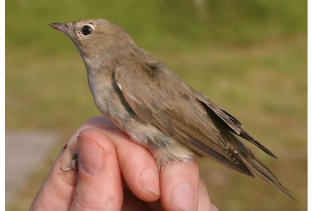
De, weliswaar schaarse, schubtekening op mantel, staart en flanken (niet op deze foto zichtbaar) onderscheidt de juveniele Spewergrasmus (links, gefotografeerd 18 september 2004, ringers: Maarten Verrips en Vincent van der Spek) te allen tijde van de Tuinfluiter (rechts, gefotografeerd 15 augustus 2004, ringers: Wijnand Bleumink, Maarten Verrips, Cocky Boelen). Het grootteverschil valt direct op als je beide soorten naast elkaar houdt, maar is op een foto moeilijk weer te geven (let op de handen).