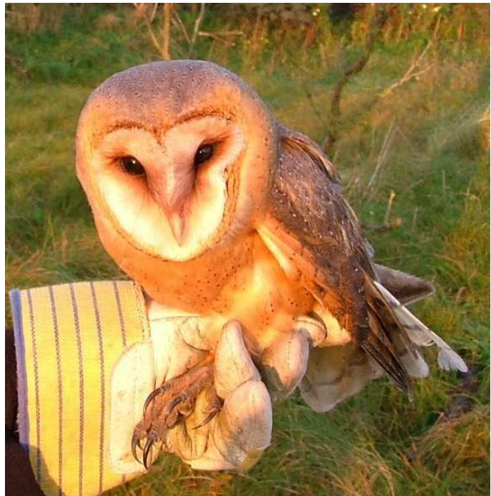
Ransuil en Kerkuil blijken meer dan incidenteel gevangen te worden in Meijndel. Met name van de Kerkuil mag dit verrassend worden genoemd. In het verslagjaar kwam ook een terugmelding van een in 2001 geringde Kerkuil. Beide foto's zijn gemaakt op 27 oktober 2004. Ringer: Maarten Verrips