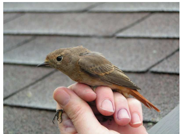
Qua vorm zijn ze gelijk, maar qua tekening verschillen mannetje (links) en vrouwje Gekraagde Roodstaart sterk. Beide vogels werden op de najaarstrek onderschept, het mannetje op 9 oktober 2004, het vrouwje op 30 september 2004. Ringer: Maarten Verrips