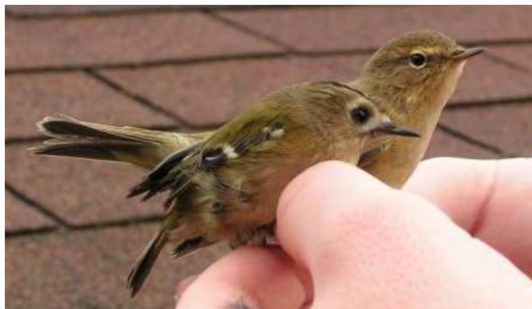
Goudhaan en Tjiftjaf, opvallend aanwezig in Meijendel in 2004. Hoewel beide soorten door ringers worden gerekend tot 'de kleintjes' is op deze foto wel duidelijk dat de Goudhaan nog een stuk tengerder is dan de Tjiftjaf. Meijendel, 16 oktober 2004. Ringer: Maarten Verrips

Twee soorten waren opvallend talrijk in 2004, de Tjiftjaf en de Goudhaan. De tjiftjaf is altijd al een van de meest gevangen soorten, die zowel in de broedtijd als in de trektijd algemeen voorkomt. Het vangstverloop in 2004 kende een aantal pieken, waarvan de eerste begin augustus kenbaar werd. Vermoedelijk betrof dit rondzwerfende jongen uit het eerste broed, waarvan we de eerste exemplaren half juni ving. Het kan evenwel ook gaan om vogels die buiten Meijendel geboren zijn: zie onder terugmeldingen. Een tweede duidelijke piek trad op in de laatste week van september terwijl na een korte terugval nogmaals een opleving was te constateren rond half oktober. Deze laatste perioden hebben zeer waarschijnlijk betrekking op doortrekkers. Half oktober beleefden we ook een absolute top in de gevangen aantallen Goudhaantjes. Tot 13 oktober wees niets op buitengewoon hoge aantallen, maar tussen 16 en 19 oktober werden 121 exemplaren geringd, bijna drie maal zoveel als voor de 16 e werden gevangen. Tussen 26 oktober en 1 november werden op drie dagen nog 27 nieuwe Goudhanen geringd maar de top was toen wel voorbij. Dit blijkt bij onze collega's van VRS Nebularia in Westenschouwen niet het geval te zijn. Hoewel ook hier half oktober een eerste duidelijke piek in de geringde aantallen Goudhanen zichtbaar is ringde men eind oktober, met name tussen 26 oktober en 1 november een tweede golf Goudhanen die nog groter was dan die van half oktober (bron: Jaarverslag 2004 VRS Nebularia)