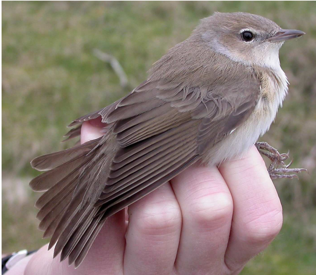
Adulte Tuinfluiter, Meijendel 2 mei 2004 Ringers: Wijnand Bleumink en Maarten Verrips