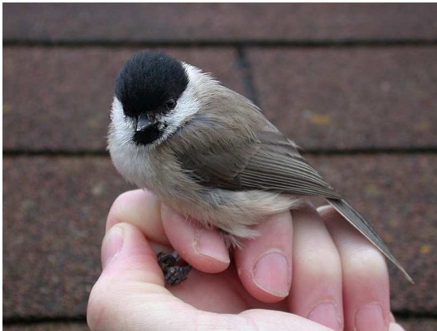
Glanskop, 24 april 2004. Deze vogel werd op 11 november 2003 door ons geringd

Inmiddels bezit de stichting een bestand van meer dan 250 tijdens de broedseizoenen 2000-2004 gecontroleerde volwassen vogels. Een uitwerking van deze gegevens wordt voorbereid.