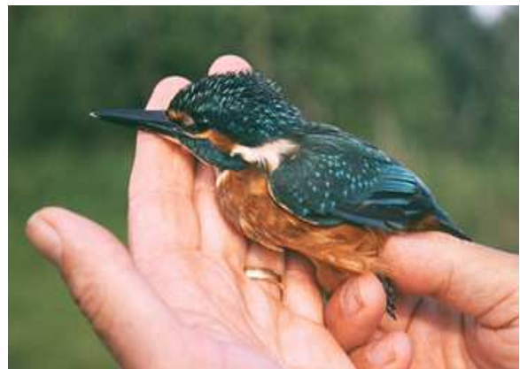
Kleurenpracht in Meijendel: een eerstejaars mannetje Witgesterde Blauwborst (22 augustus 2004, ringers: Maarten Verrips, Cocky Boeken, Peter Weiland) en een IJsvoegel (31 juli 2004, ringers: Wijnand Bleumink en Vincent van der Spek)